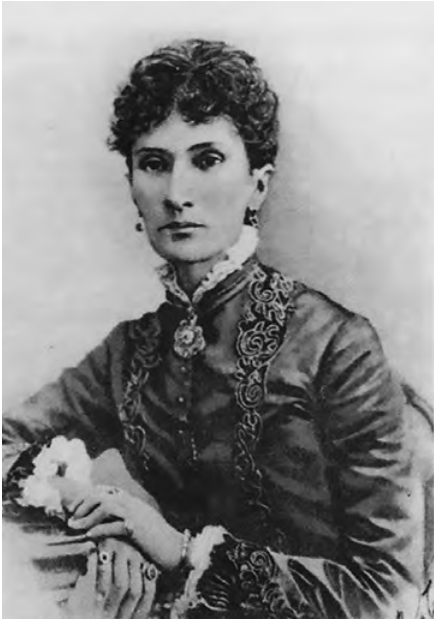
Н. Ф. фон Мекк, 1876 г.

Когда Надежде Филаретовне исполнилось 45, её супруг скоропостижно скончался от сердечного приступа. Однако вдова, оставшись с огромным капиталом, акциями, предприятиями, земельными угодьями и недвижимостью в России и Франции, с великим знанием дела потянула тяжёлую трудовую лямку мужа. Ей удавалось всё: от присмотра за многочисленными имениями до ведения металлургического и сахарного производств. Сахароварение всегда было и технологически сложным, и материально затратным. «...Знаете, сколько мне стоили посев, обработка и доставка на завод свекловицы с пятисот двадцати четырёх десятин?! – 101331 руб. 34 к.!!! Не правда ли, что это баснословно?» — находим мы в одном из писем фон Мекк Чайковскому.