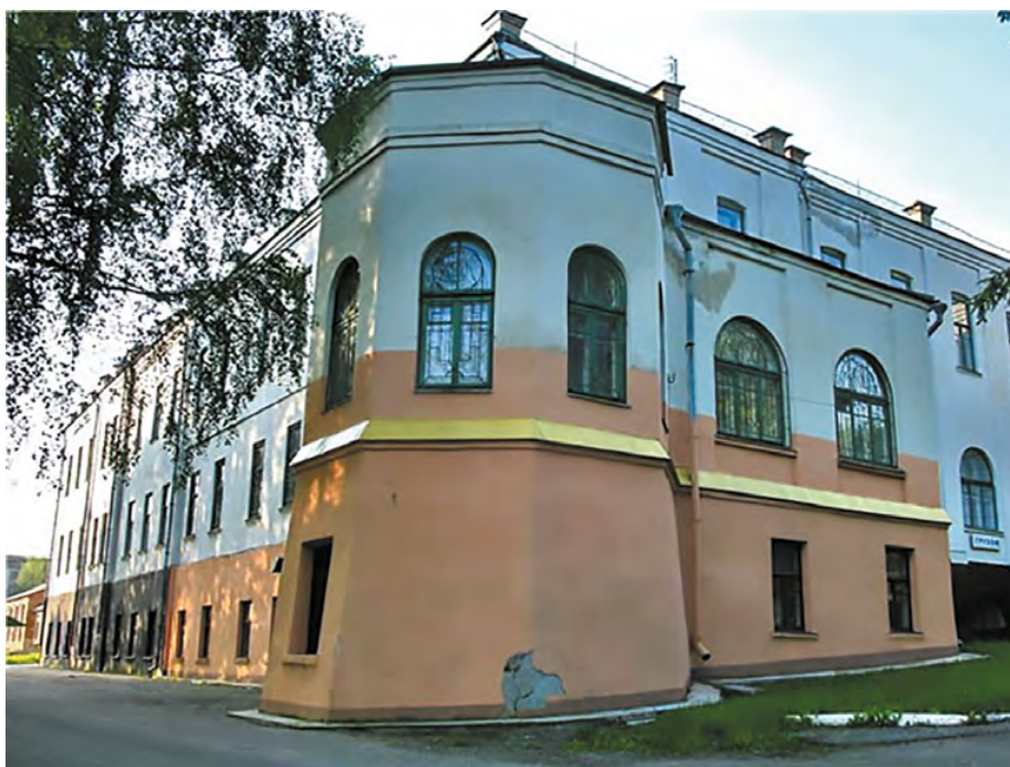
Усадьба фон Мекк в Браилове. В башне сегодня располагается музей П.И. Чайковского и Н.Ф. фон Мекк

ловской, Ландварово-Роменской, Курско-Киевской, Моршанской и других железных дорог. Имущество семейства начало прирастать разбросанной по стране и за её пределами недвижимостью, а в фамильные закрома потекли деньги.