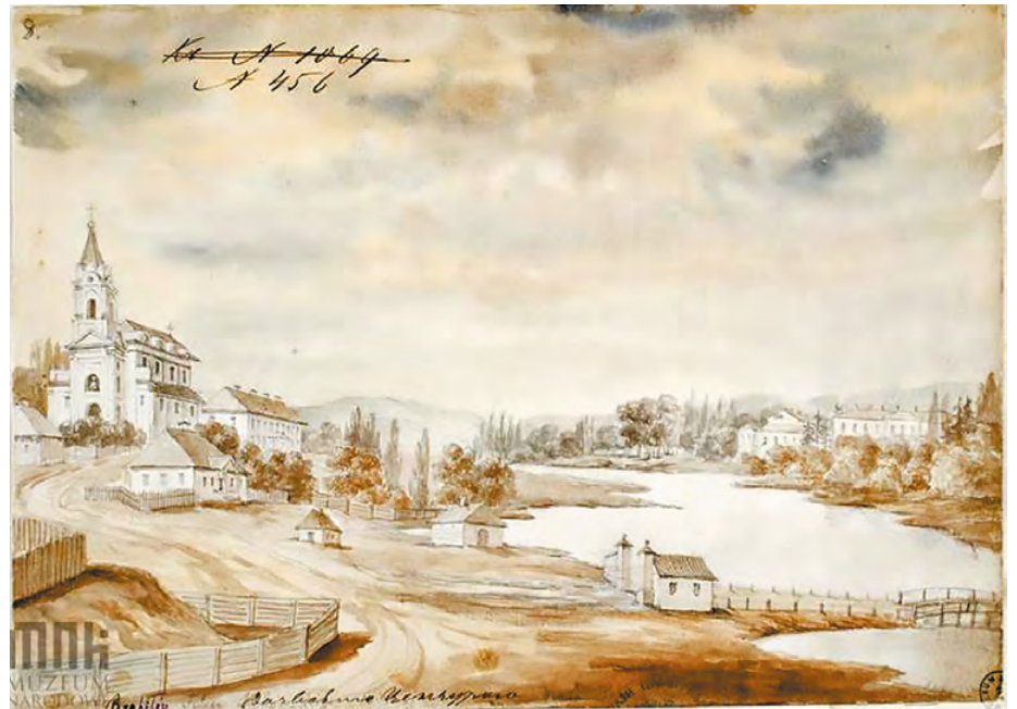
Окрестности Брайлова. Акварель Наполеона Орди, 1871–1874 гг. (Национальный музей Кракова).

Баронесса финансировала деятельность любимого творческого объединения «Мир искусства», щедро поддерживала юные таланты. В одном из её московских особняков, на Рождественском бульваре, 12, провёл последние дни жизни знаменитый польский скрипач