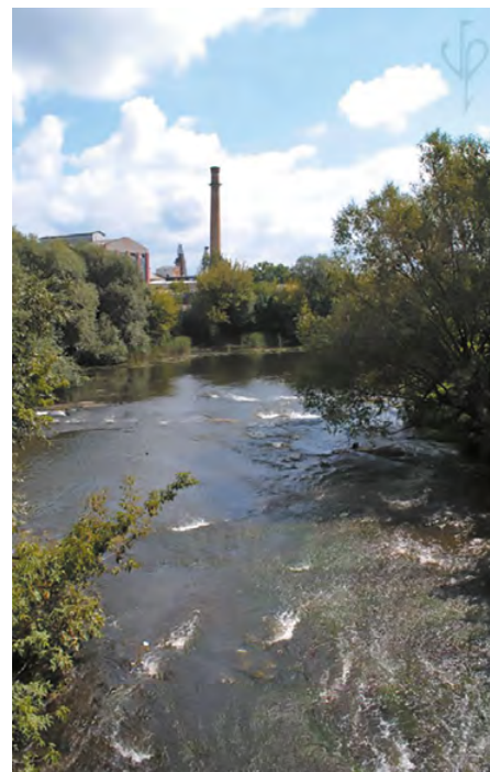
Браиловский сахарный завод

Надежда Филаретовна умерла в 1894 г. в возрасте 63 лет от туберкулёза, пережив Чайковского на год. Её, как и супруга, погребли в отстроенном на погосте московского женского Алексеевского Красносельского монастыря в фамильном склепе. Образ усыпальницы написал художник Михаил Нестеров, близкий семье фон Мекк, но с закрытием обители и разорением кладбища судьба икон покрылась тайной. Семейный склеп Фон Мекк был варварски разрушен в 1929 г. Помещения бывшего хозяйского дома в браиловской усадьбе сегодня отданы под профтехучилище, бывшие шикарно меблированные спальни, кабинеты и гостиные превратились в учебные классы со стандартным казённым инвентарём. Единственный маленький островок XIX в. сохранился в небольшой дворцовой башенке, где разместились музей Чайковского и фон Мекк.